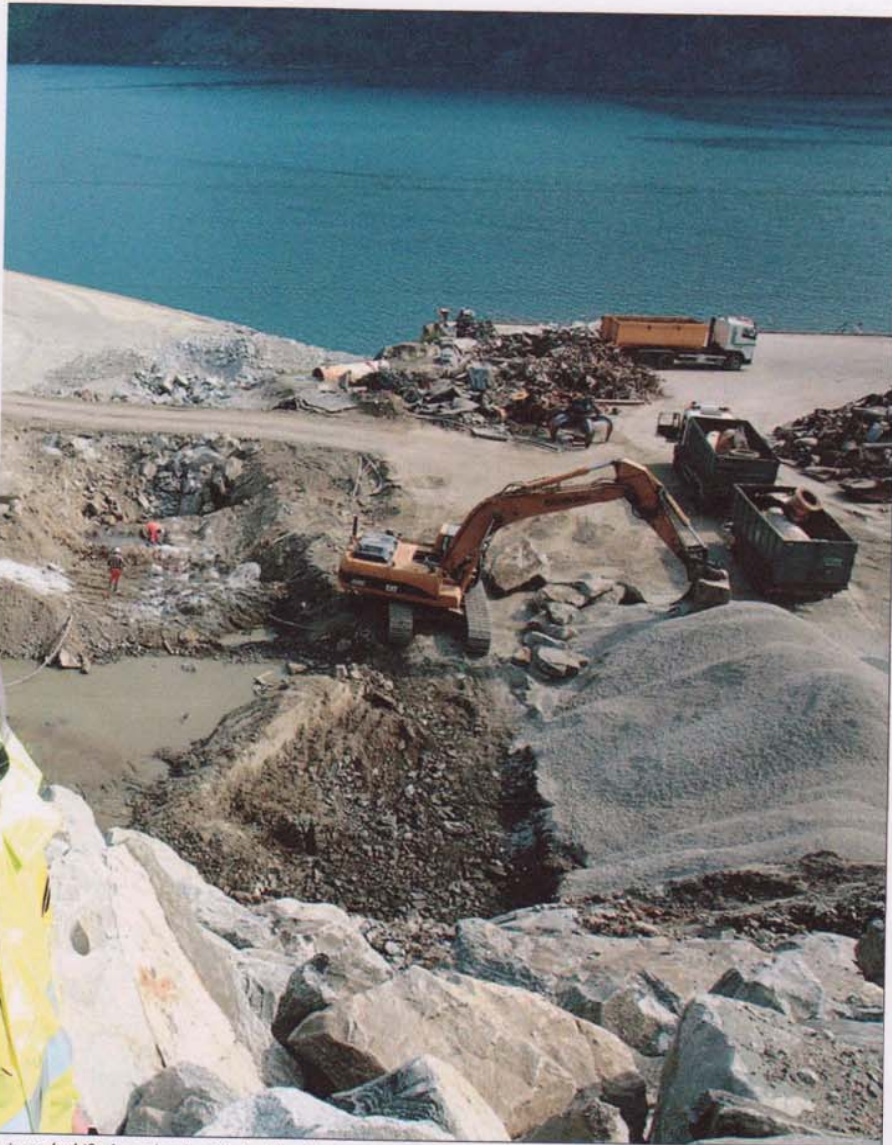
ing og bedrifta har søknader til behandling i kommunen eller ikkje.