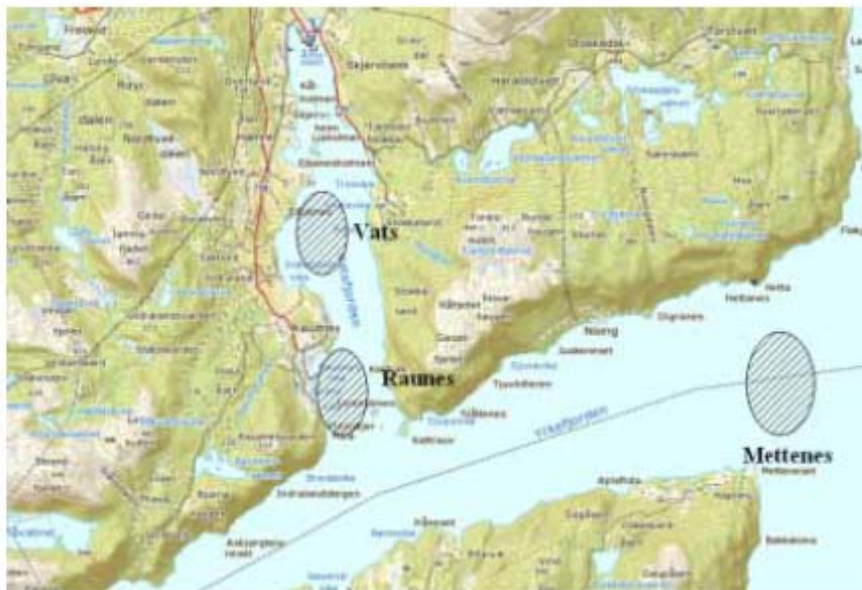
Figur 9: Kart over området for fiske av torsk og krabbe i perioden fra høsten 2011 til høsten 2012.